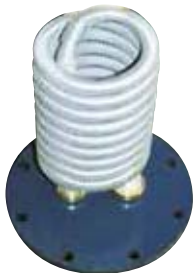
A kivethető, felületkezelt réz hőcserélő biztosítja a másodlagos melegvíz előállítását

The coil fitted is a copper heat exchanger