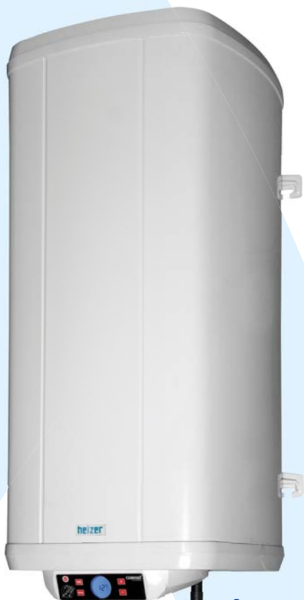
Ti-EP PRO - digitális termosztáttal